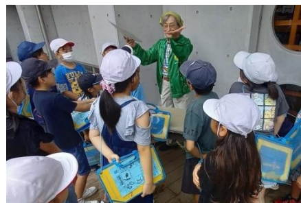
葉っぱの料理教室